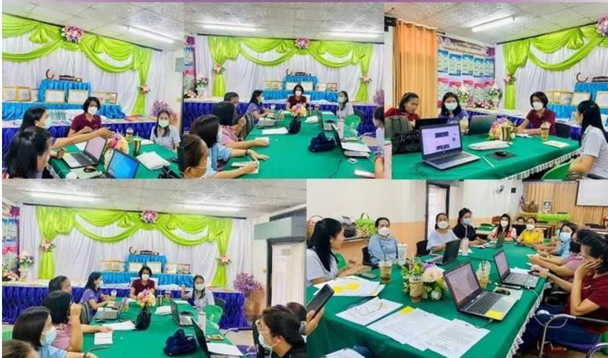
การประชุมเกี่ยวกับการดำเนินการตามหลักเกณฑ์และวิธีการประเมินวิทยฐานะแนวใหม่ (ว 21/2560)

สำนักงานเขตพื้นที่การศึกษาประถมศึกษาอุดรธานี เขต 1