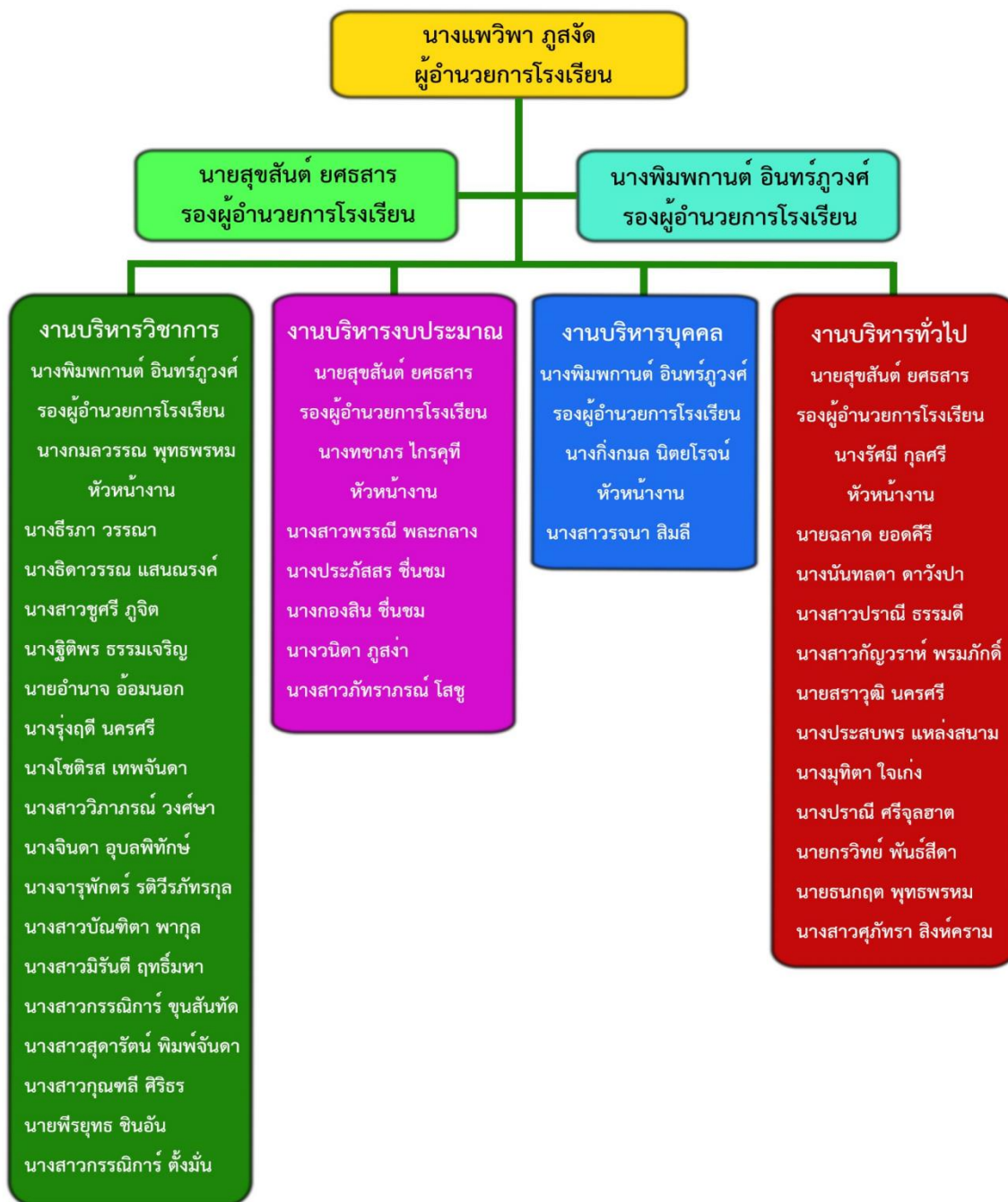
แผนภาพที่ ๑ โครงสร้างการบริหารงานโรงเรียน